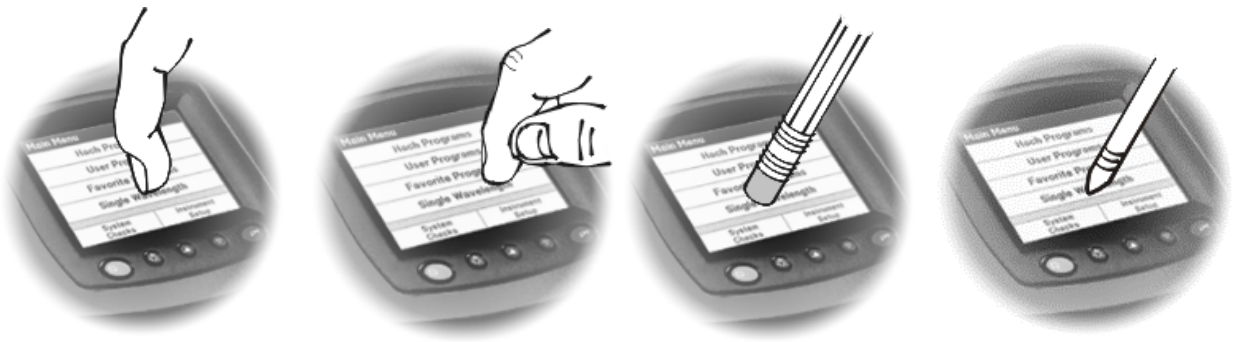
图 3 不同的触摸屏浏览方式