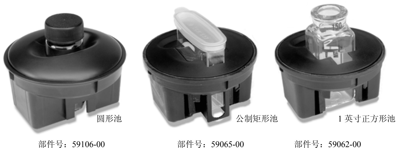
图 6 样品池固定架

注意：1 英寸正方形池与大多数的哈希程序都是不匹配的，但是可以被用户程序所采用。