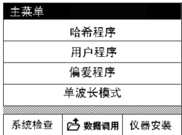
图 5 主窗口——高级软件